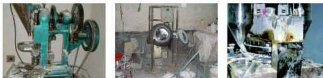
中国をはじめとする海外で偽造現場を摘発された製造工場の一例。